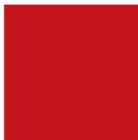
T-1936F ノウレッド 3 [マンセル値] (H) 6, 61R (V) 4, 10 (C) 13, 55