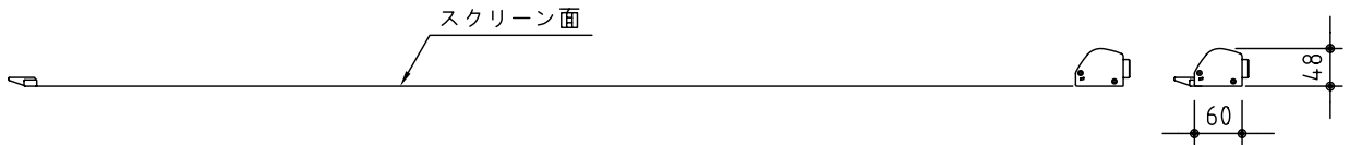
マグネットスクリーン S=1/10