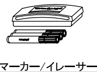
マーカー/イレーサー