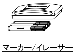
マーカー/イレーサー